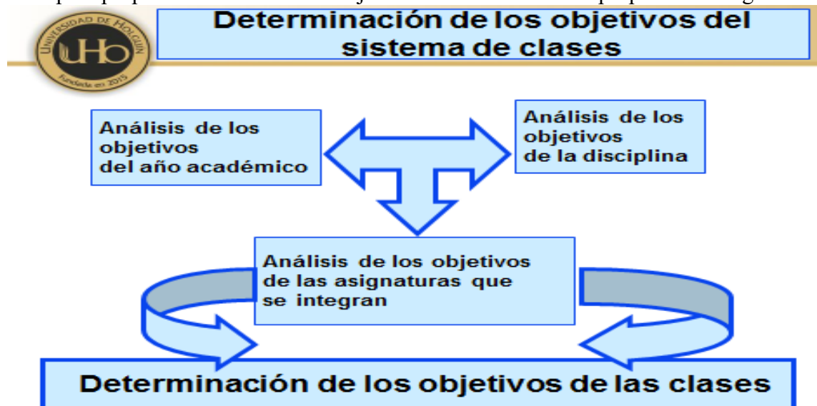
Figura 2. Relación entre el sistema de objetivos de una disciplina. Elaboración de los autores

Mantener como prioridad del trabajo metodológico, la relación y determinación de los objetivos para proponer certeramente el objetivo de la clase como se propone en la figura 2.